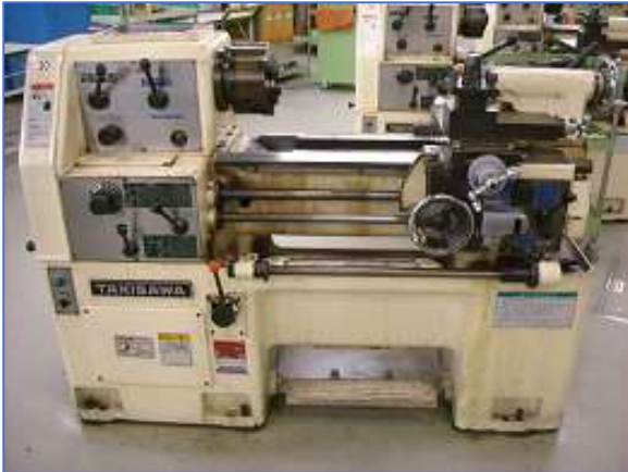
滝澤 T S L 5 5 0