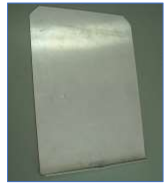
図面台 1 (単品)