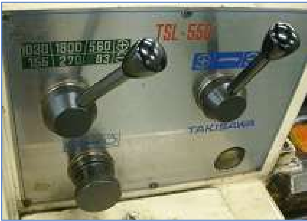
主軸速度変換レバー