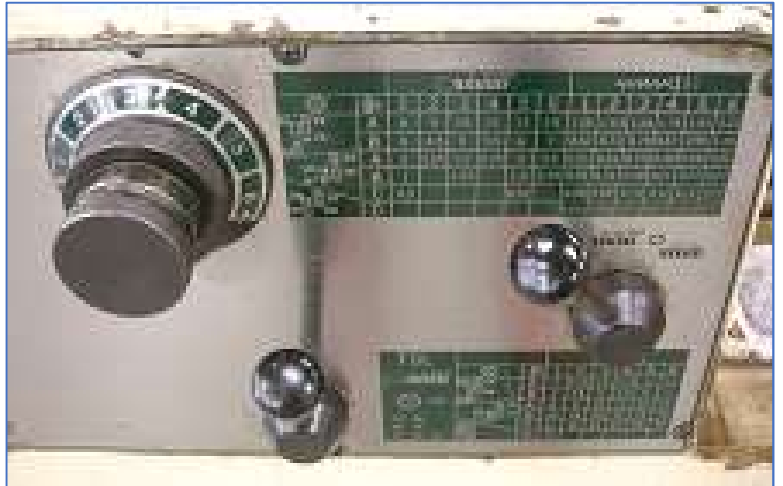
ねじ切り表、自動送り表